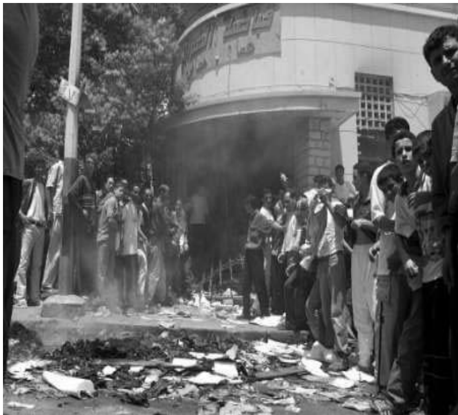
Saqueio e incêndio de um tribunal durante a extensão geográfica do movimento (12/06/01)

provincia insurgente, para sufocar os riscos de “contaminação”.